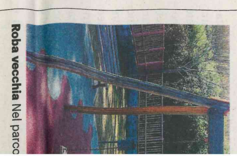
Roba Vecchia Nel parco