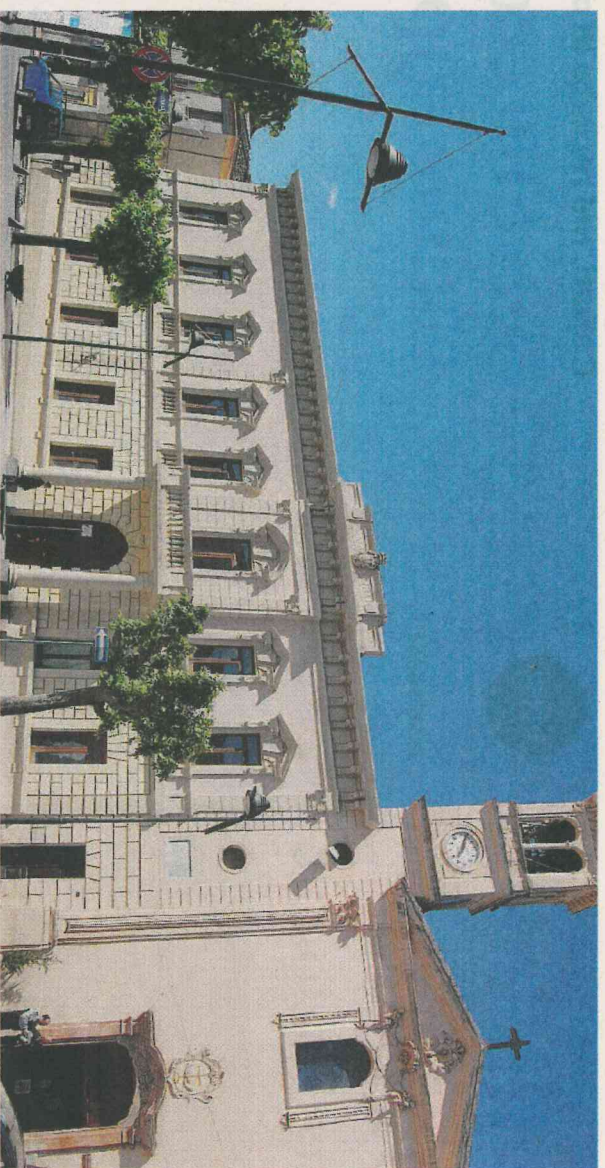
Il Municipio. Le parti sociali aprono il dibattito sul futuro dei lavoratori comunali

nguito del- per un ap- a artificia- 20 da me, Brad Smi- tivo di Ibn e generale appresen- tala mini- tecnologia rivescovo