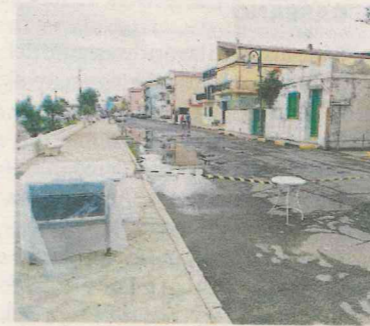
Un fiume di liquami La giunta Greco ha diffidato la ditta della manutenzione

stanza di giorni non sia portato a soluzione e che la ditta affidataria del servizio non sorvegli attentamente e costantemente il sistema soprattutto nel periodo estivo, rendendosi addirittura irreperibile». È quanto denuncia l'amministrazione comunale di Cariati, informando che si è provveduto da più giorni a diffidare la ditta ad adempiere a quanto pre-